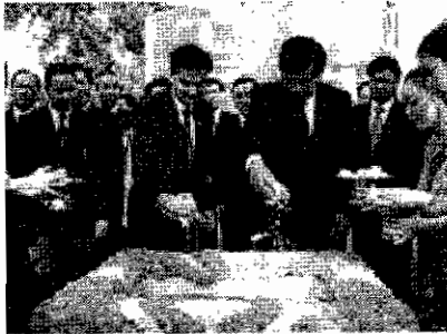
Mr Bouasone Bouphavanh ( right ) and Mr Abhisit Vejjajiva lay a foundation stone for the construction of an indoor stadium in Beungkhayong village, Sisattanak district, Vientiane.

Thailand's Prime Minister Abhisit Vejjajiva last Friday paid an official visit to Laos to advance bilateral relations and cooperation in projects including road and rail links between Laos and Thailand .