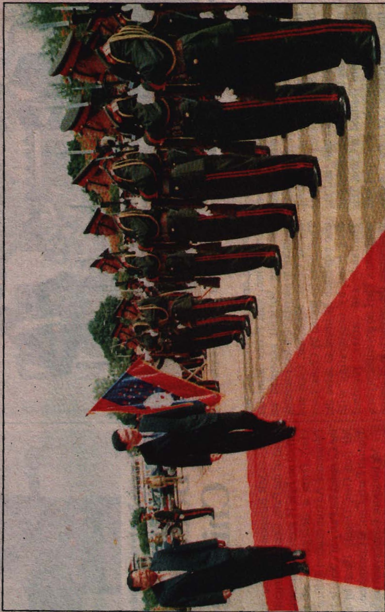
Thai Prime Minister Thaksin Shinawatra (left), accompanied by Lao Prime Minister Bounyang Vorachit, inspect a guard of honour marking the arrival of the Thai Premier.