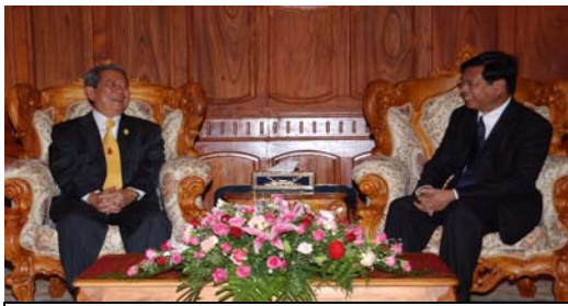
การหารือข้อราชการระหว่าง ฯพณฯ นายกรัฐมนตรี กับ ฯพณฯ บัวซอน บุนผาวัน นายกรัฐมนตรีลาว ณ สำนักงานนายกรัฐมนตรี

ฯพณฯ นายกรัฐมนตรี กล่าวถึงการเดินทางเยือน สปป.ลาว ว่า ได้รับการต้อนรับ อย่างอบอุ่นจากประชาชนและรัฐบาลลาว โดยได้มีการหารือทวิภาคีกับ ฯพณฯ บัวซอน บุนผาวัน