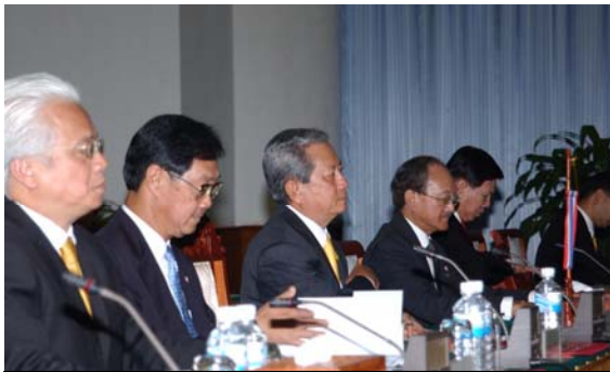
การหารือเต็มคณะระหว่าง ฯพณฯ นายกรัฐมนตรี กับ ฯพณฯ บัวซอน นูบผาวัน นายกรัฐมนตรีลาว ณ สำนักงานนายกรัฐมนตรี

ปลายเดือนตุลาคม ศกนี้ พร้อมทั้งได้มีการหารือถึงปัญหาทางการเมือง สถานการณ์ทางใต้ของ ไทย ซึ่ง ฯพณฯ นายกรัฐมนตรีลาวได้แสดงความเข้าใจและเชื่อมั่นต่อรัฐบาลไทยในการบริหาร ประเทศ รวมทั้งยังได้แสดงความเห็นใจต่อปัญหาน้ำท่วมที่ไทยกำลังเผชิญอยู่ในขณะนี้ นายกรัฐมนตรีทั้งสองฝ่ายยืนยันที่จะคงความร่วมมือทวิภาคีระหว่างทั้งสองประเทศต่อไป โดยจะ มอบหมายให้หน่วยงานที่เกี่ยวข้อง เร่งรัดดำเนินโครงการความร่วมมือของทั้งสองประเทศ อาทิ โครงการสร้างสะพานข้ามแม่น้ำโขง แห่งที่ 3 (จังหวัดนครพนม-แขวงคำม่วน) การเชื่อมเส้นทางรถไฟ จากไทยผ่านลาวไปยังประเทศเวียดนาม การจัดซื้อพลังงานไฟฟ้าจากลาว การป้องกันและปราบปรามยาเสพติด การป้องกันการลักลอบการข้ามแดนโดยผิดกฎหมาย ปัญหา “มั่งเพชรบูรณ์” รวมทั้งการให้ความช่วยเหลือการป้องกันการแพร่ระบาดของไข้หวัดนก/ไข้หวัดส้วตวิปัก และความ ร่วมมือด้านวิชาการภายใต้กรอบ ACMECS